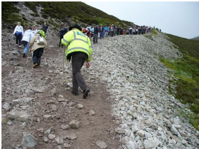
Rada Patricku mäele

umbes 30000 palverändurit. Aastas võtab selle teekonna ette umbes miljon inimest.