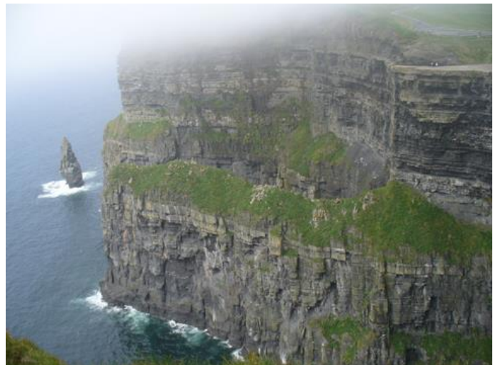
Cliff or Moher

Cliff of Moher – kõrgeim punkt, mis on 214 m ja kulgeb mööda Atlandi Ookeani rannikut 8 km ulatuses. On üks külastatavamaid atraktsioone Iirimaal. Seal on tehtud ka „Harry Potteri“ filmi jaoks võtteid. Atraktsioon on kantud Seitsme Maailma Ime hulka 2010. aastal.