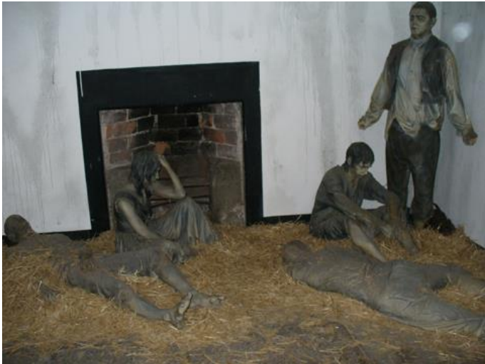
Kurnatud vange kujutavad vahakujud

Veel oli söökla, haigla, kabel, ja pesumaja. Kokku hoiti vanglas 780 vangi. Kogu vanglasisest meeleolu aitavad luua giidid, kes on riietatud selleaegsesse riietusse ja jutustavad analoogsel tämbril nagu see vanglaametniku puhul kohane oli, ja vangla piinatud elanikud- ehk vahakujud kambrites.